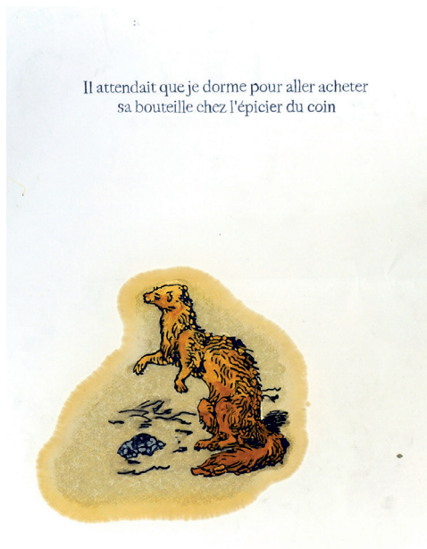
Il attendait que je dorme pour aller acheter sa bouteille chez l'épicier du coin

Gérald Panighi, Au final le job se révèle ennuyant à mourir , 2020, Dessin sur papier à la mine de plomb, crayon de couleur, huile de lin, 70 x 50 cm