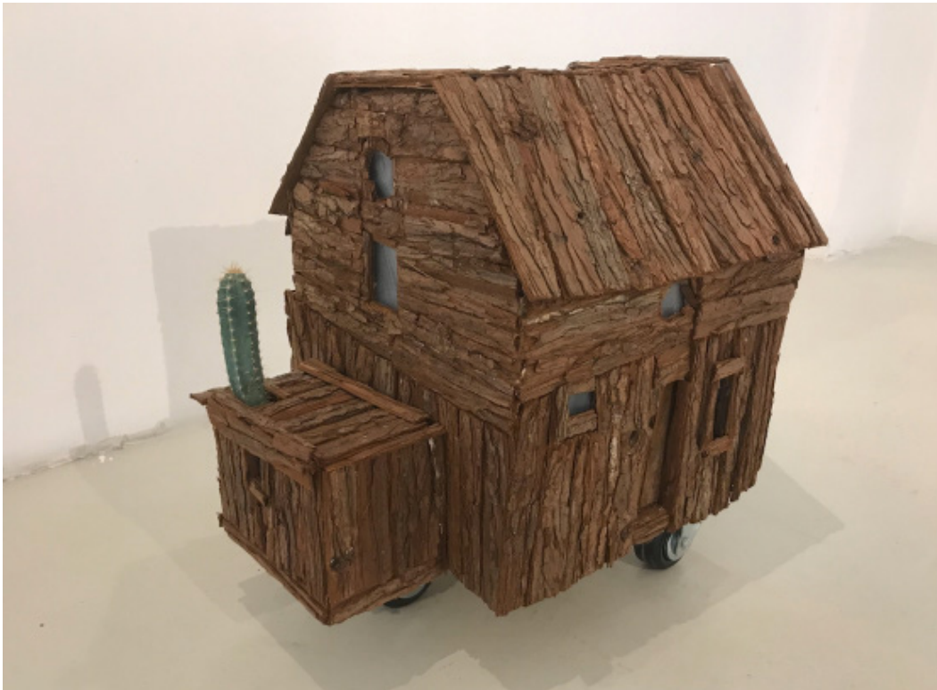
Laurie Jacquetty Cactus caravane 1, 2020