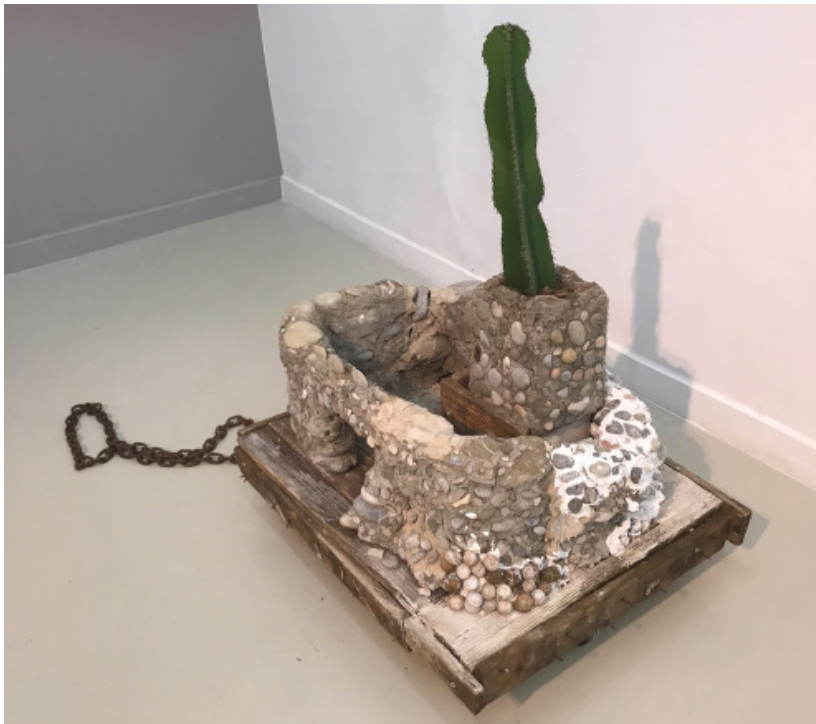
Laurie Jacquetty Cactus caravane 2, 2020

Ses sculptures dénotent aussi une économie de moyen : elles sont fabriquées à partir d'une collecte de matériaux pauvres, d'objets récupérés, dérisoires et précaires. Evoluant au fur et à mesure des trouvailles et des combinaisons, elles ne sont pas pensées comme une forme achevée mais exécutées dans une certaine urgence avec ce qui s'offre spontanément à elle et avec des gestes élémentaires rappelant ceux de l'enfance. Ses assemblages de bric et de broc prennent le sens de l'habitation, du refuge et renvoient à l'idée de catastrophe à venir même si elles peuvent prêter à sourire par leurs associations parfois fortuites et leur caractère naïf.