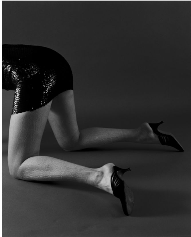
Natacha Lesueur, Sans titre , 1996, 100 x 100 cm Epreuve gélatino argentique baryté