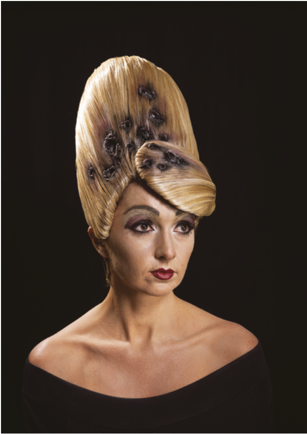
Natacha Lesueur, Carine , 2015, 100 x 80 cm Photographie analogique, Épreuve Lambda sur ilfoflex