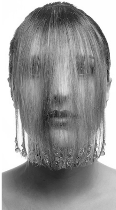
Natacha Lesueur, Chantal , 2007, 437 x 217 cm, Photographie analogique, Épreuve Lambda sur ilfoflex