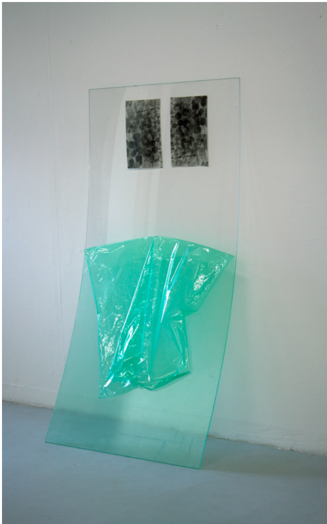
Anita Gauran, Rayogrammes extrait de la série Sans titre , 2013, épreuves argentique sur papier baryté, épingles