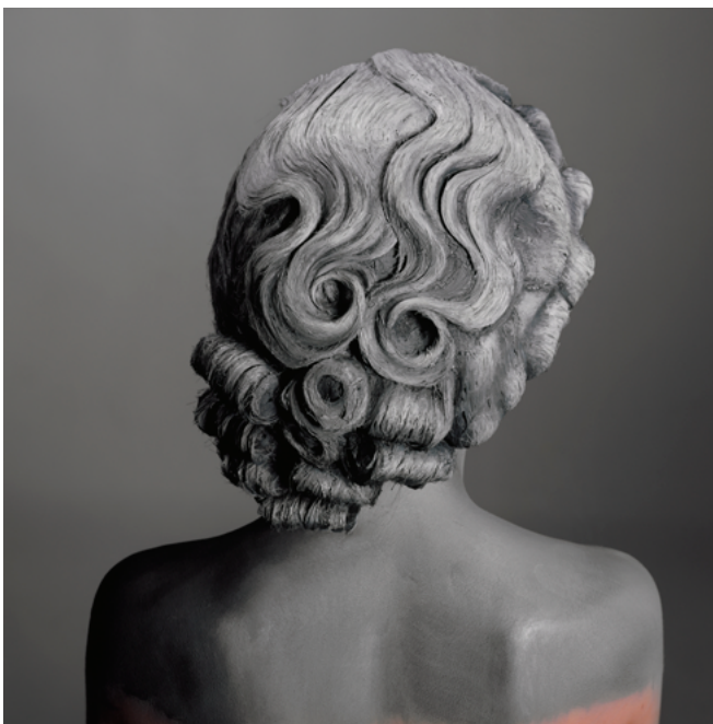
Natacha Lesueur, Sans titre , 2015, 60 x 60 cm Photographie analogique, Épreuve baryté