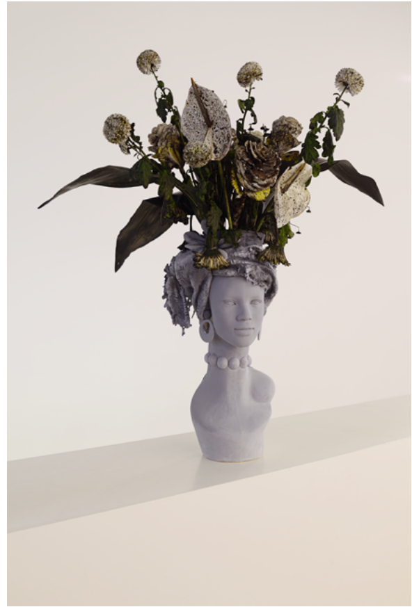
Natacha Lesueur, Sans titre , 2014, Faïence engobe gris 50 x 30 cm