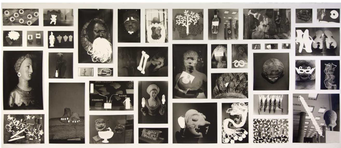
Anita Gauran, Rayogramme , dimensions variables épreuves argentique sur papier baryté, épingles